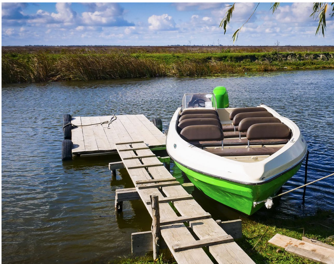
Delta del Danubio, Rumanía.