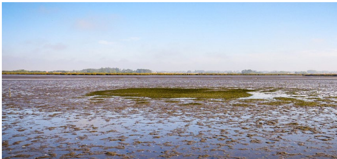
Ría de Aveiro, Portugal.