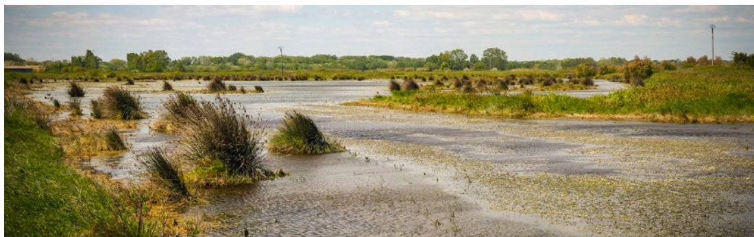
Camarga, Francia.

Se aplicó un enfoque participativo de análisis multicriterio (MCA), que combinaba las evaluaciones científicas de expertos sobre los impactos ambientales, socioeconómicos y socioculturales en la gestión de la restauración con las preferencias de las partes interesadas locales recabadas a través de talleres y encuestas. Los resultados de esta interacción se analizaron a través de ocho dimensiones representadas en la «flor de la aceptabilidad social» (Figura