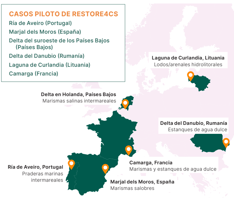
Figura 1. Sitios piloto del caso RESTORE4Cs.

El proyecto RESTORE4Cs examinó los factores que influyen en la aceptabilidad social de la restauración de los humedales costeros (Figura 1) en seis emplazamientos europeos.